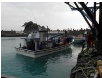
Fishing boat arriving Dongao harbour, Taiwan

At NTU, fish are measured and weighed. Sex and maturity stage are determined by examining the gonads, and female gonads are preserved for measuring the egg size. Otoliths are extracted for age reading. Genetic markers are used to confirm the species identity (important for spotting an odd Trichiurus lepturus among the similar looking Trichiurus japonicus ).