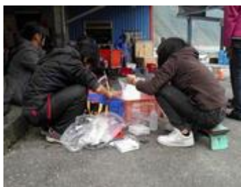
Taking tissue samples from cutlassfish in Dongao harbour.